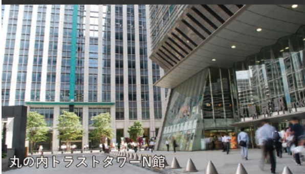
丸の内トラストタワー N館